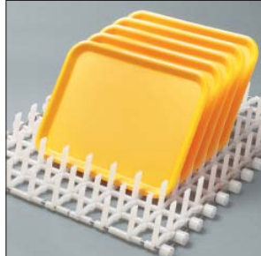
Fingerband mit senkrecht stehenden Fingern.