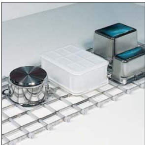
Flaches Band für Container, Töpfe und Kunststoffbehälter.