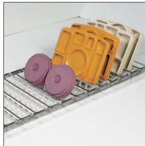
Temp-rite-Band für Temp-rite-Tablettts mit Deckel.