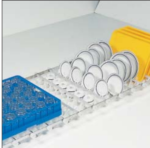
Standardband mit Aussparungen für flache und tiefe Teller, Tassen und Tablettts. Auch geeignet für Behälter und Körbe.

Die RHIMA WD-B Maschinen können mit verschiedenen Bandtypen geliefert werden. Einige Beispiele: