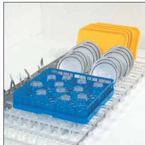
Band mit Aussparungen und Besteckspur für Tablettts, flache und tiefe Teller und Körbe mit Gläsern oder Tassen.